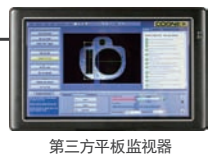
第三方平板监视器